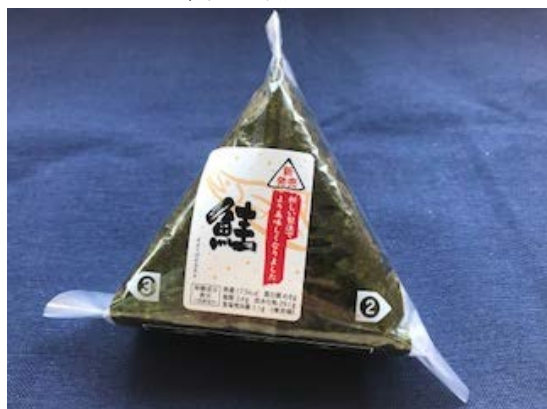
手巻きおにぎり鮭（本体価格85円）