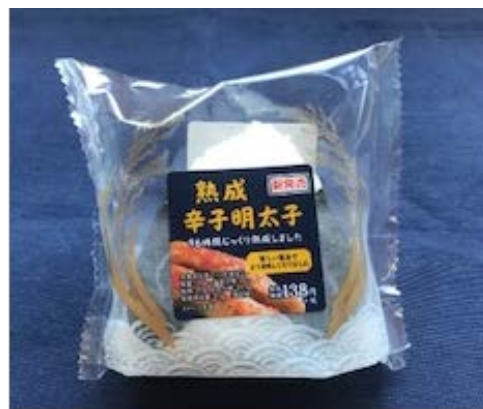
こだわりおにぎり熟成明太子（本体価格138円）